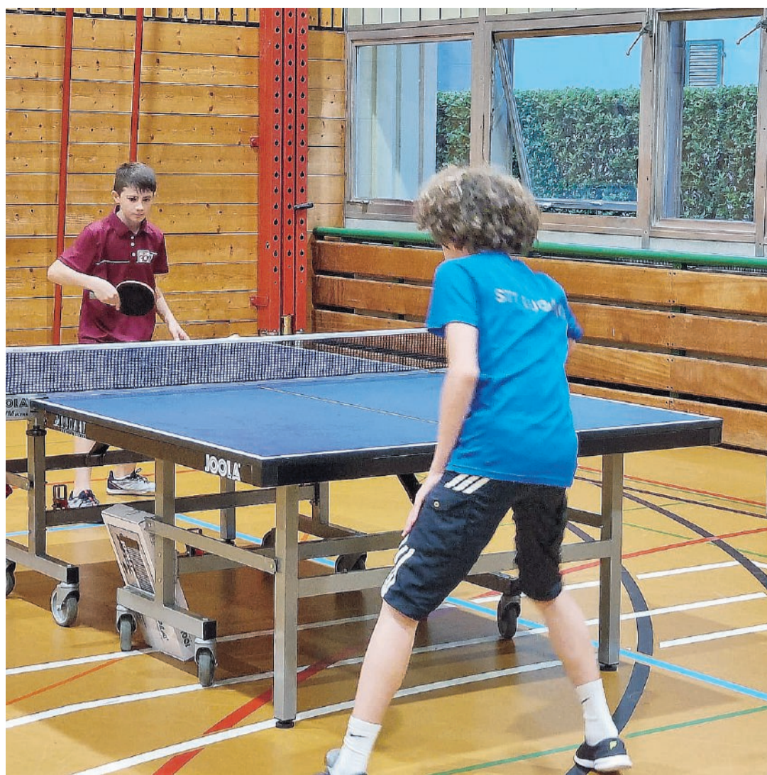
Una quarantina i ragazzi iscritti

L'Associazione bellinzonese tennis tavolo ha peraltro ottenuto un notevole successo nell'ultimo anno. Durante la stagione sportiva 2022-23 ha raggiunto importanti risultati e ha conquistato il titolo in tutte e tre le categorie dei campionati regionali ticinesi di tennis tavolo: la prima, la seconda e la terza divisione. Ma le loro vittorie non si sono fermate qui. Sono infatti diventati anche campioni svizzeri nella categoria dei non tesserati, vincendo il prestigioso trofeo dello School Trophy. «Questo è un risultato che sottolinea la nostra dedizione e il nostro impegno costante nel promuovere il tennis tavolo a tutti i livelli. Inoltre