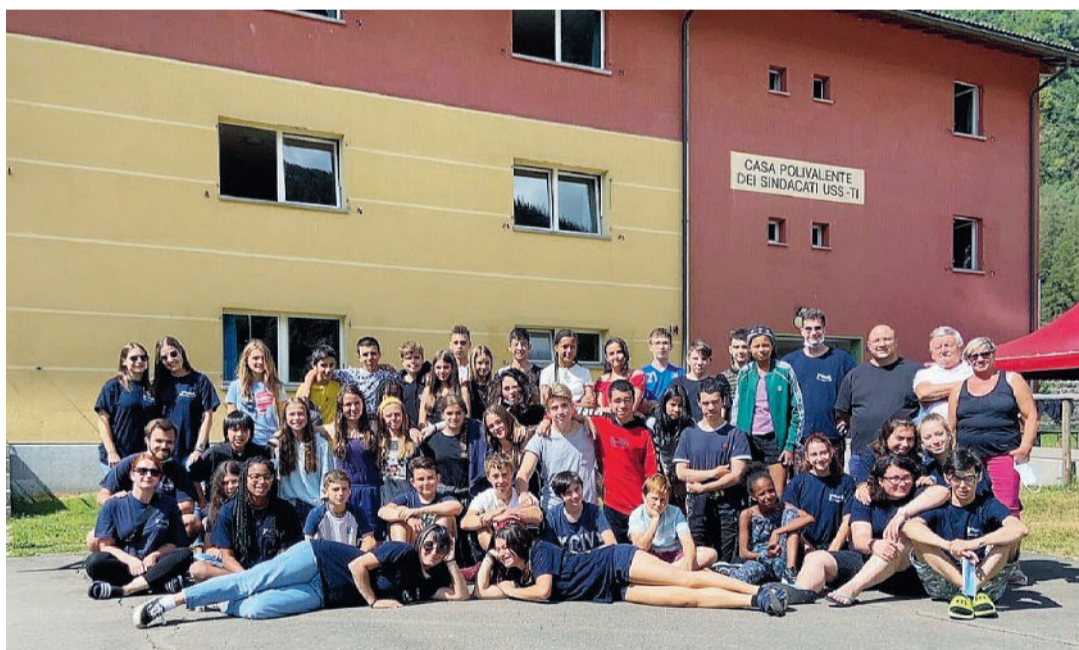
La casa polivalente dei sindacati

Il 26 e 27 agosto dibattiti e condivisione di ricordi